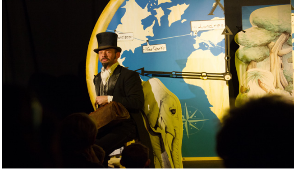
«Et c'est parti pour le voyage avec Kiouni!»