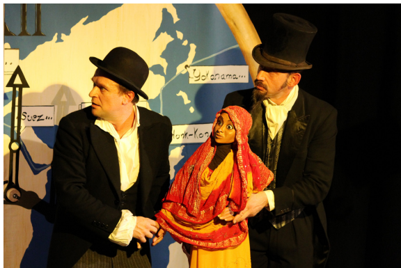
«Deux policemen les attendent sur le quai de gare...!»