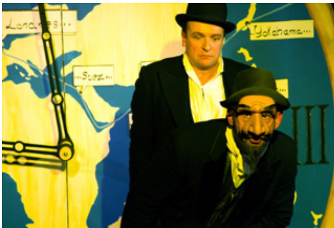
L'inspecteur Fix et Passepartout