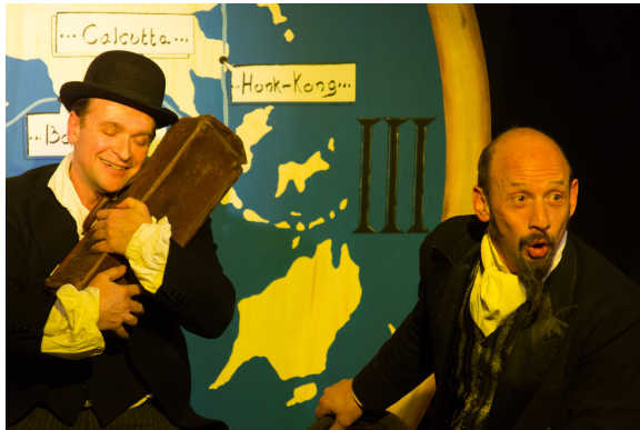
«Il rêve sans doute d'aventures extraordinaires...»