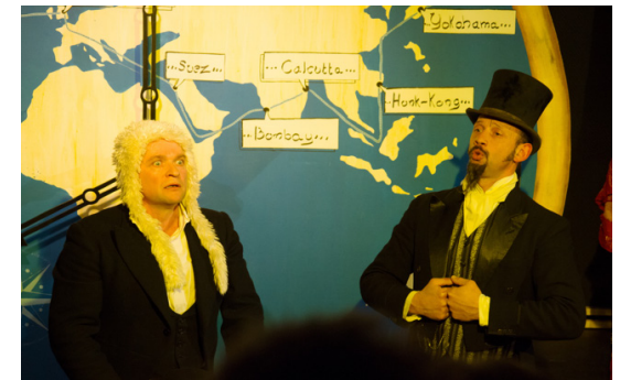
«Vous êtes condamné à 8 jours de prison et 150 livres d'amende...»