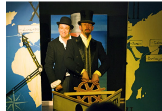
Passepartout: «Le voyage se passe, les premiers temps les vents sont favorables puis ils deviennent défavorables comme d'habitude»