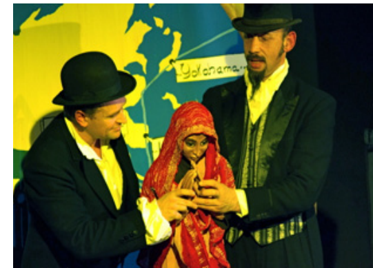
«Elle les accompagne donc sur l'invitation de Phileas Fogg»

Un voyage qui les emmène de l'Europe jusqu'en Amérique en passant par L'Inde, Hong-Kong, la Chine et le Japon!