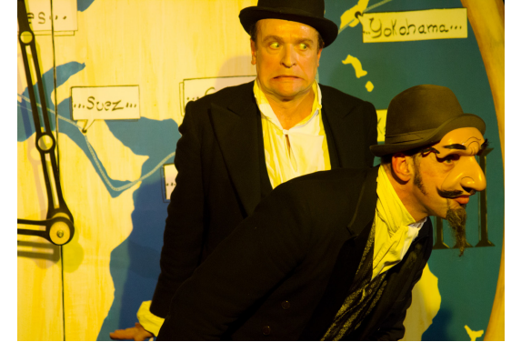
Passepartout: «Ne disons rien à mon maître et surveillons notre espion...»