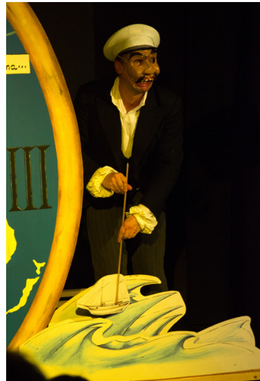
Pilote: «Le Japon? mais c'est loin ça!...»