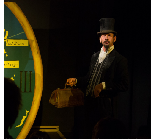
Fogg: «Ce sac contient la moitié de ma fortune...»