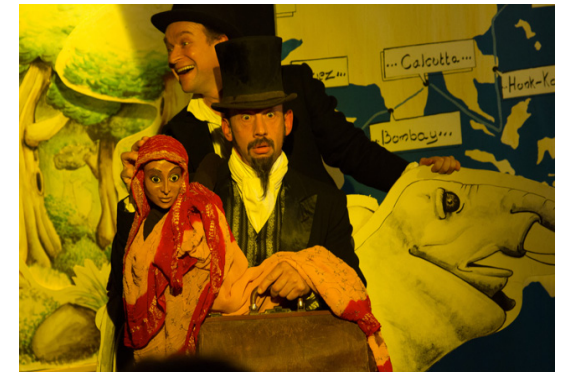
Passepartout: «Nous sommes poursuivis